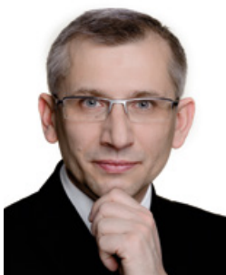
Krzysztof Kwiatkowski – Prezes Najwyższej Izby Kontroli

Honorowy członek zarządu Stowarzyszenia Auditorów Wewnętrznych w Polsce (IIA Oddział w Polsce).